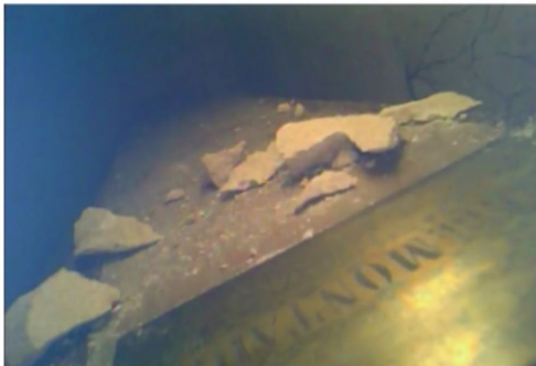
Vue de l'intérieur du caveau en caméra filaire, octobre 2018

Comment vivaient nos ancêtres il y a des centaines, voire des milliers d'années? A quoi ressemblaient-ils, que mangeaient-ils? Répondre à ces questions, c'est le travail des archéologues. Les collaborateurs de la structure Archéologie Alsace nous font visiter un chantier de fouilles à Obernai, avant de nous expliquer comment ces reliques du passé seront restaurées et conservées.