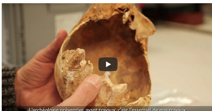
L'archéologie préventive, avant travaux, c'est l'essentiel de nos travaux.

NÎMES Nouvelles fouilles et nouvelles découvertes. Situés dans le centre de Nîmes, des vestiges de deux maisons romaines viennent d'être mises au jour par les archéologues de l'Institut national de recherches archéologiques préventives.