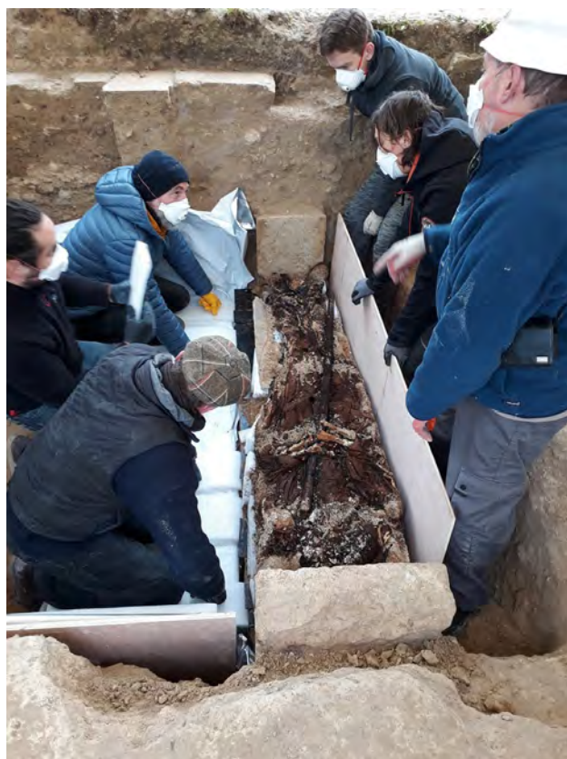
Soissons (Aisne) Ancienne abbaye Saint-Médard Dépense de la sépulture de l'abbé Aubry de Braine († 1206)