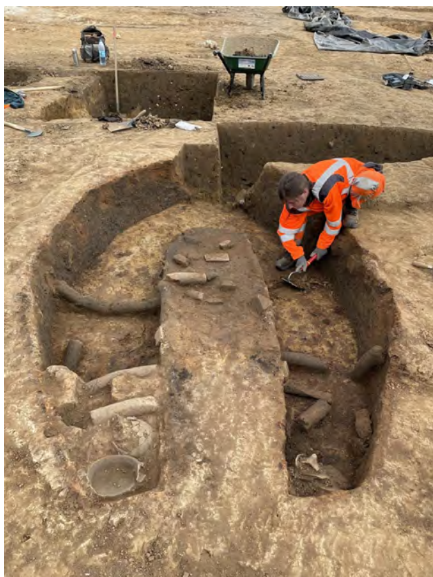
Thérouanne / Saint-Augustin (Pas-de-Calais) Four de potier et de terre cuite architecturale du Moyen Age en cours de fouille

Entrée libre dans la limite des places disponibles et selon les normes sanitaires en vigueur