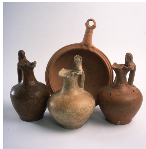
Oenochoe Patère.

Musée de Picardie 48, rue de la République, 80000 Amiens Tel : 03 22 97 14 00 musees-amiens@amiens-metropole.com www.amiens.fr/musees Relations presse : h.lefevre@amiens-metropole.com