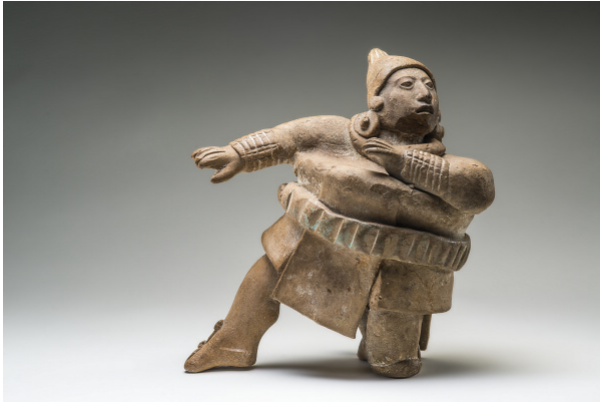
Figurine de joueur de balle – Jaina Classique récent (600-900 ap. JC) Céramique

La vie rituelle était essentielle pour les Mayas. D'après leurs rites cosmogoniques, les êtres humains furent créés pour vénérer et nourrir les dieux dont dépend l'existence de l'univers.