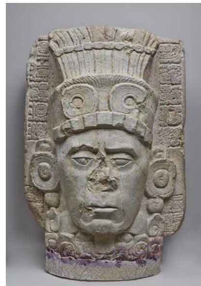
Figure humaine – Palenque Classique récent (600-900 ap. JC) Sculpture en pierre

L'abondante représentation d'êtres surnaturels ou de divinités dans l'aire maya s'explique principalement par la vénération des strates cosmiques : le ciel, la terre et le monde souterrain, ainsi que des forces naturelles comme le Soleil, la Lune ou la Pluie.