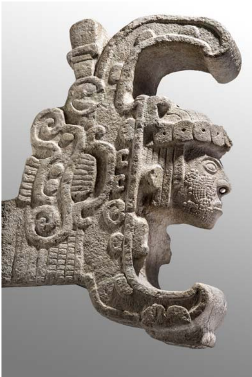
La Reine d'Uxmal Classique récent (600-900 ap. J.-C.) Calcaire

Écrivain, historienne et académicienne, chercheur émérite du Centre d'études mayas de l'UNAM (Universidad Nacional Autónoma de México) et membre permanent du comité scientifique de l'INAH (Instituto Nacional de Antropología e Historia, Mexique).